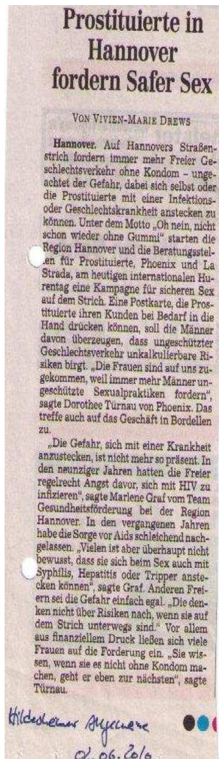
Hildesheimer Allgemeine Zeitung 02.06.2010