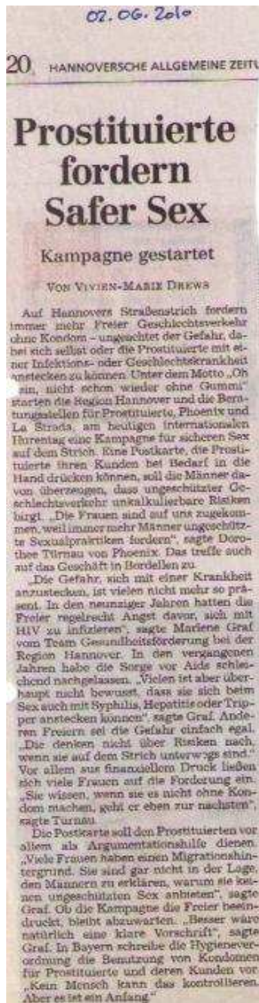
Hannoversche Allgemeine Zeitung 02.06.2010